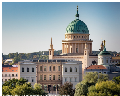
Städtchen Potsdam mit Museum Barberini

Stadt und gehören zum UNESCO-Weltkulturerbe. Nach der Ankunft im Hotel haben Sie die Möglichkeit sich Ihrer Reiseleitung zu einem orientierenden Spa-ziergang anzuschließen oder Sie entspannen im hoteleigenen